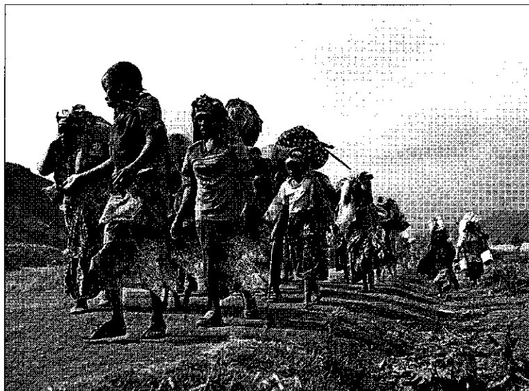
► Els conflictes entre forces rebels i del govern a l'est del Congo han provocat que milers de persones fugin lluny de les seves llars.