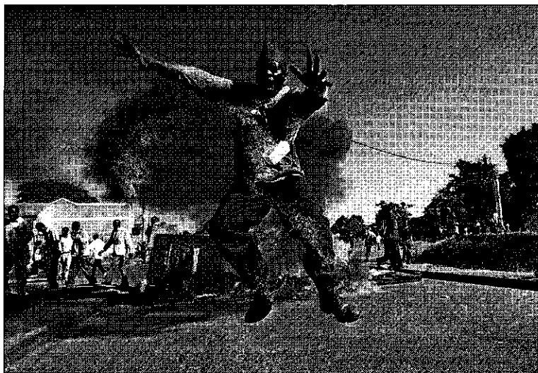
► Després de les eleccions generals de Kenya, els carrers del país es convertiren en camps de batalla on van morir centenars de civils.